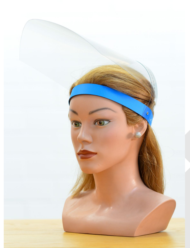
Blaues Kopfband: Prototyp / Erstproduktion